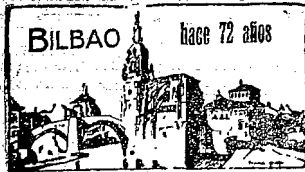
BILBAO hace 72 años