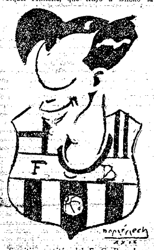
Samitier, capitán del F. C. Barcelona

Porque si pensamos en un Blasco en su mejor forma, protegido por un Castellano todo movilidad y nervio, junto a la veterania y el gran juego de Urquiza, tenemos que pensar en esa formidable línea