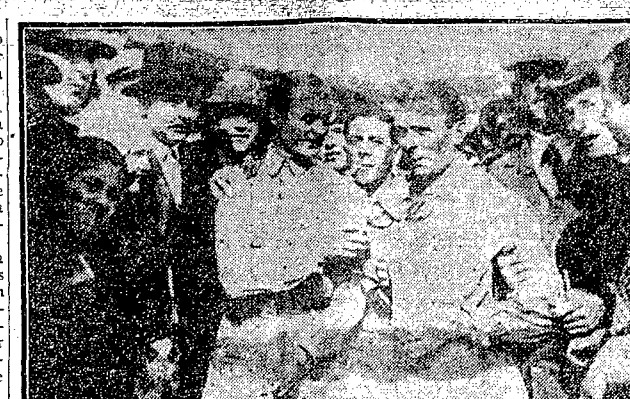
En la meta de la carrera, tribunas de Cerda, Louis Chiron felicita a Achille Varzi, el campeón italiano, por su espléndida victoria en la Targa Florio 1930 con el "Alfa-corsa" dos litros, batiendo todos los records. La primera victoria italiana desde 1923.