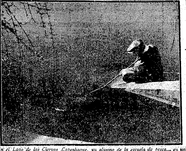
En el Lago de los Ciervos, Copenhague, un alumno de la escuela de pesca... en un entrenamiento.

Se está creando en Francia la "literatura de la naturaleza", rama nueva de la literatura, con sus libros especiales para el conocimiento de las plantas (acuatías y terrestres), de las plantas y de las cosas, en sus vidas y movimientos en la Naturaleza misma.