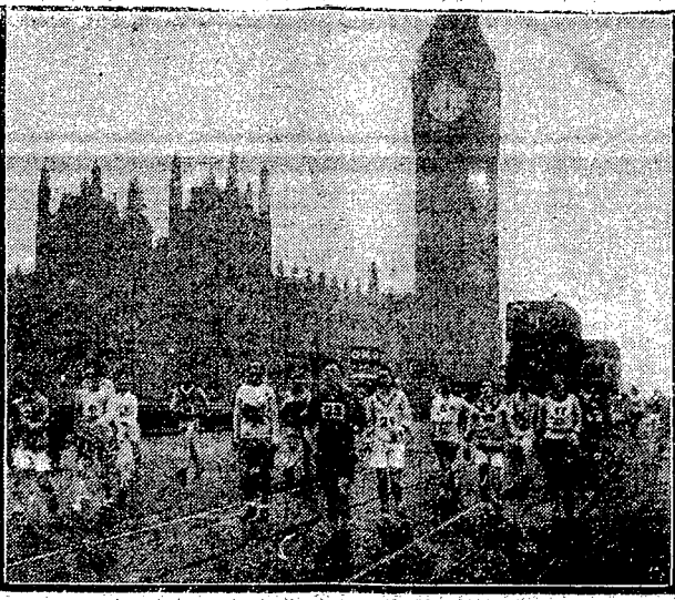
La clásica prueba de marcha London-Brington. Los participantes, de madrugada, inician la prueba, junto al mismo Parlamento británico